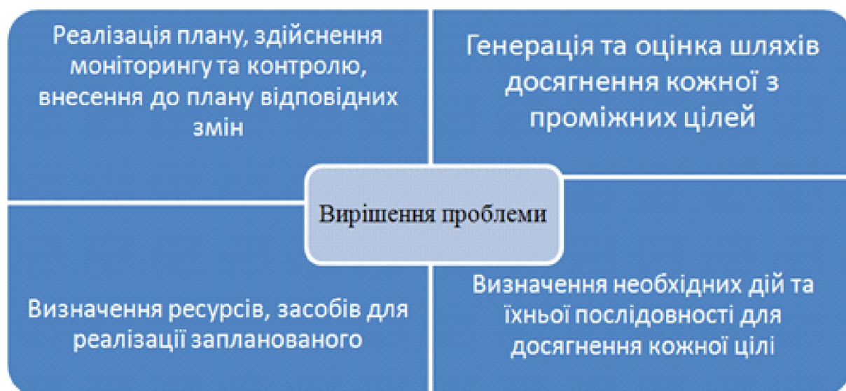
Рис. 1. Схема планування етапів розв'язання проблеми