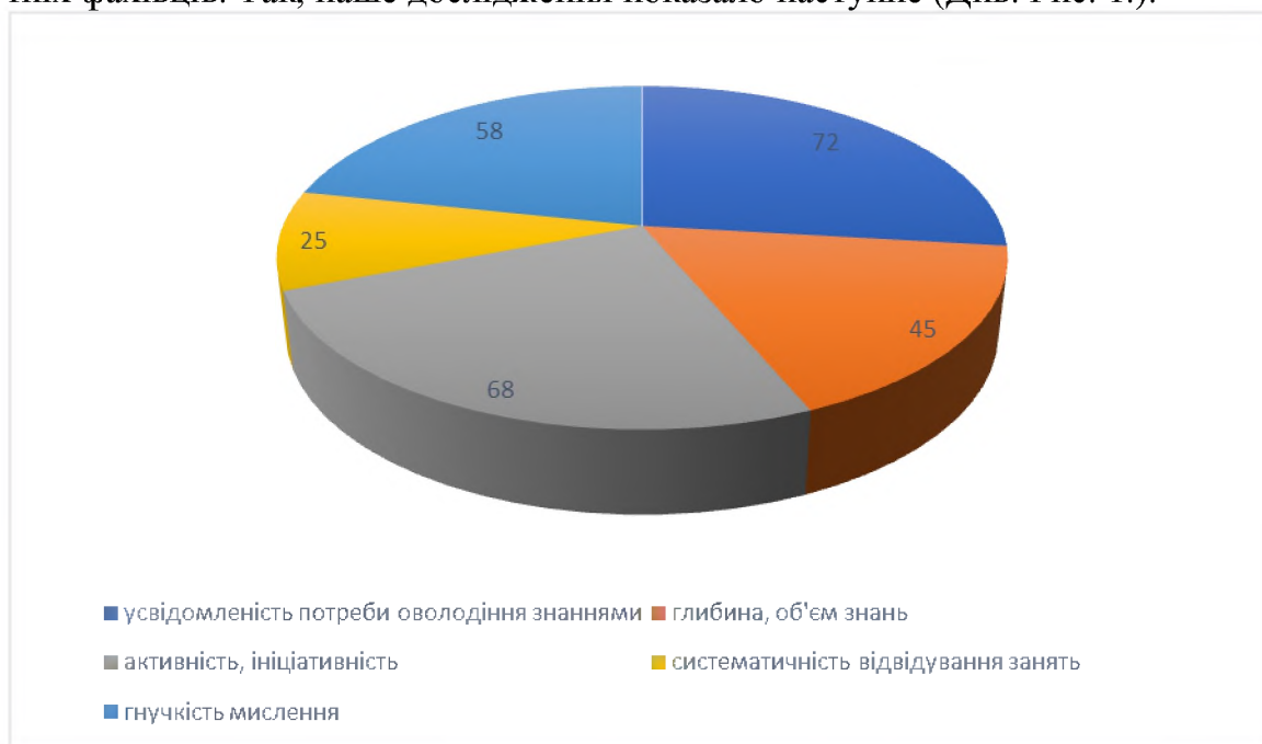
Рис. 1. Професійні риси та якості майбутніх фахівців

Намагаючись проаналізувати ефективність формування педагогічної майстерності майбутніх фахівців початкової освіти ми провели експериментальне дослідження на базі ДВНЗ “Прикарпатський національний університет імені Василя Стефаника”. Нами було охоплено магістрантів спеціальності “Початкова освіта” 1-го (61 особа) та 2-го року навчання (72 особи) денної форми. У процесі спостереження за магістрантами, шляхом включення їх у різні форми роботи та види діяльності ми намагалися з’ясувати рівень сформованості складових педагогічної майстерності майбутніх фахівців. Так, наше дослідження показало наступне (Див. Рис. 1.):